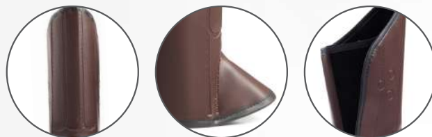
03 Talas de PVC